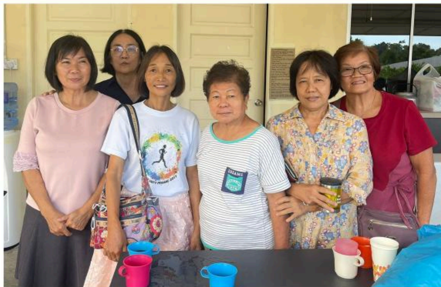
美里、诗巫的传道员合影。