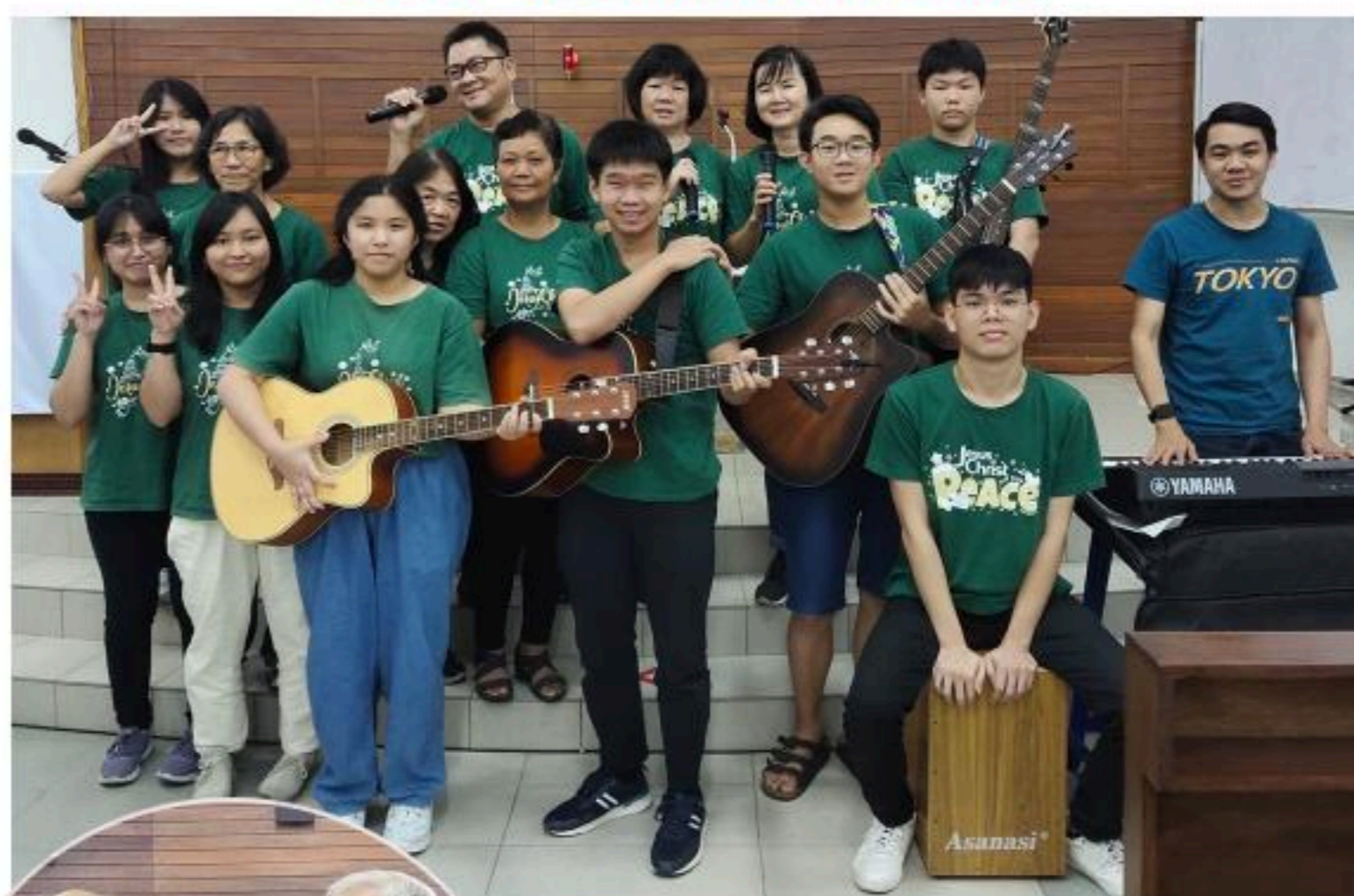
音乐侍奉小组合影。